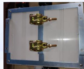
単管取付け用金具 (裏面)